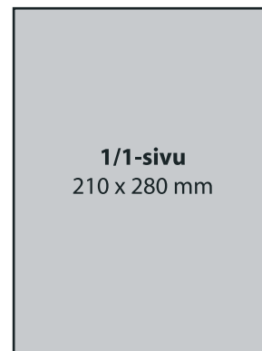
1/1-sivu, 4-väri 1 500 €