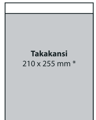
takakansi, 4-väri 1 900 €

* Takakannen yläreunasta 25 mm valkoinen alue koko sivun leveydeltä varattu postin merkintöjä varten.